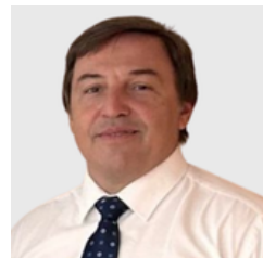
Δρ. ΔΗΜΗΤΡΗΣ ΨΥΧΟΓΙΟΥΣ

Γενικός Γραμματέας Οικονομικής Πολιτικής και Στρατηγικής, Υπουργείο Εθνικής Οικονομίας και Οικονομικών